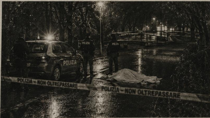
Il luogo del ritrovamento transennato dagli agenti della Squadra Mobile.

Inoltre, secondo quanto appreso dalla nostra redazione, le telecamere dell'area erano state disattivate da almeno 48 ore.