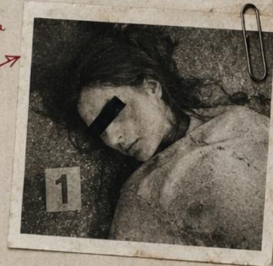
Foto scattata sul posto

Identificazione eseguita da: Commissariato di P.S. Ravenna in data 13/10/20XX alle ore 10:15.